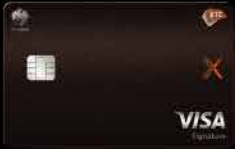
KTC X VISA SIGNATURE