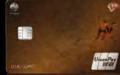
KTC UNIONPAY DIAMOND