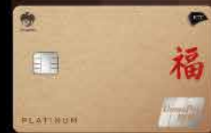
KTC UNIONPAY PLATINUM