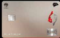
KTC JCB PLATINUM