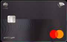
KTC PLATINUM MASTERCARD