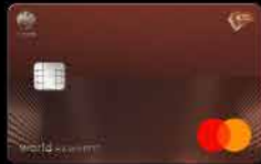
KTC WORLD REWARDS MASTERCARD