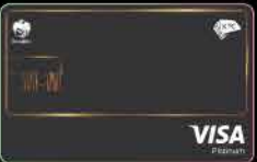
KTC DIGITAL PLATINUM VISA