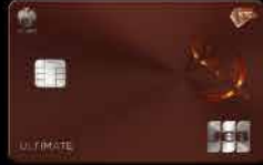
KTC JCB ULTIMATE