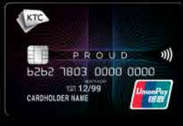
บัตรเครดิตเงินสด KTC PROUD